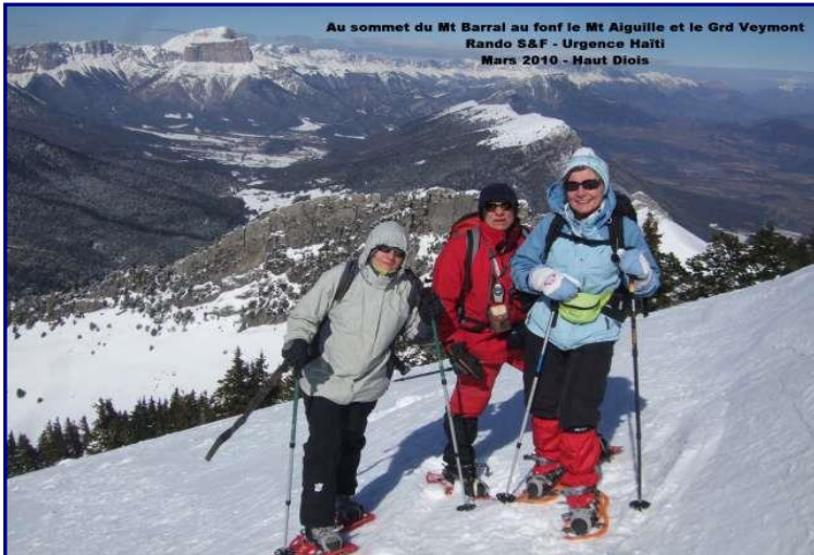
Au sommet du Mt Barral au fond le Mt Aiguille et le Grd Veymont Rando S&F - Urgence Haïti Mars 2010 - Haut Diois