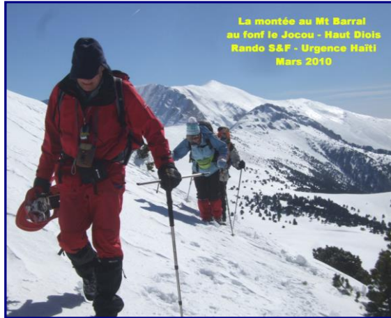
La montée au Mt Barral au fond le Jocou - Haut Diois Rando S&F - Urgence Haïti Mars 2010