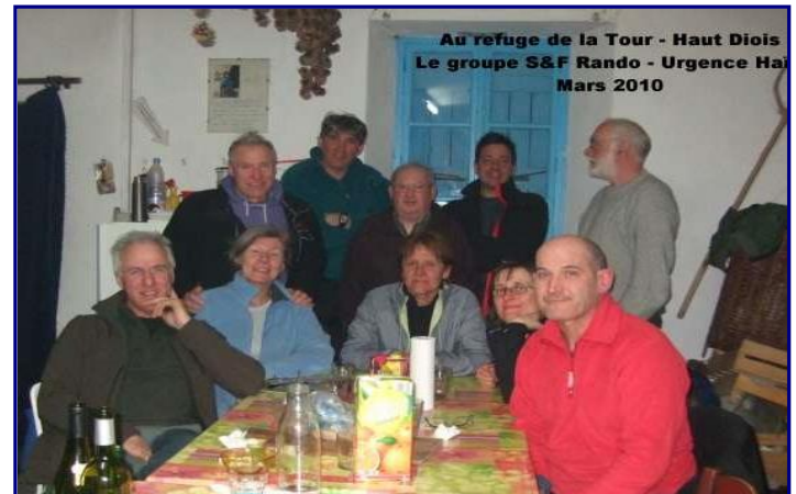
Au refuge de la Tour - Haut Diois Le groupe S&F Rando - Urgence Haïti Mars 2010